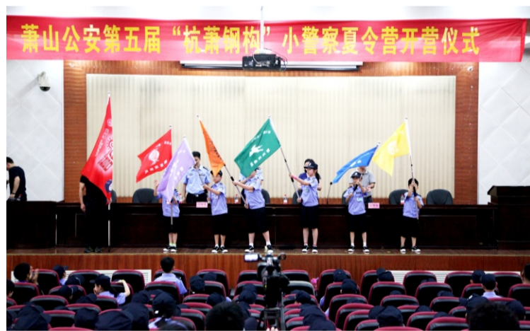
▲7月9日下午，穿上警服的“小警察”代表们接过营旗，夏令营活动正式开始啦。

面，受到千种呵护、万般溺爱的孩子们吃的苦少了，身体素质也弱了，“杭萧钢构”小警察夏令营的举办，是弘扬爱国主义精神，展现强警文化的体现；同时也是对未成年人成长的一份关爱和助力，让他们亲近热爱警队，增强国防观念，增加安全意识。六天五夜的活动，使“小警察”坚强、勇敢、乐观向上的精神在夏令营里扩散和延续。