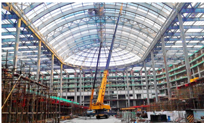
日前，由浙江杭萧钢构股份有限公司承建的罗蒙环球城——室内游乐场项目主体结构封顶。此为结构封顶后的图片

本报讯 8月30日上午，在一片热情洋溢的氛围中，微生态健康产业基地首期工程1号厂房钢结构安装工程如期开工。业主总裁助理曾宪维、现场负责人李发坚，监理公司总监曾总、专业监理工程师周工，杭萧钢构副总经理胡迎祥、制造部经理张强、制作项目经理田磊及项目管理全体成员参加了此次开工仪式。